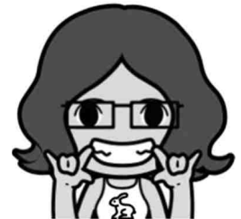
Mélanie MULLER Présidente

- Passer au Bureau du CEA, 11 Rue des lits militaires – 06600 Antibes (2 ème étage de l'ascenseur mais 3 ème par les escaliers !)